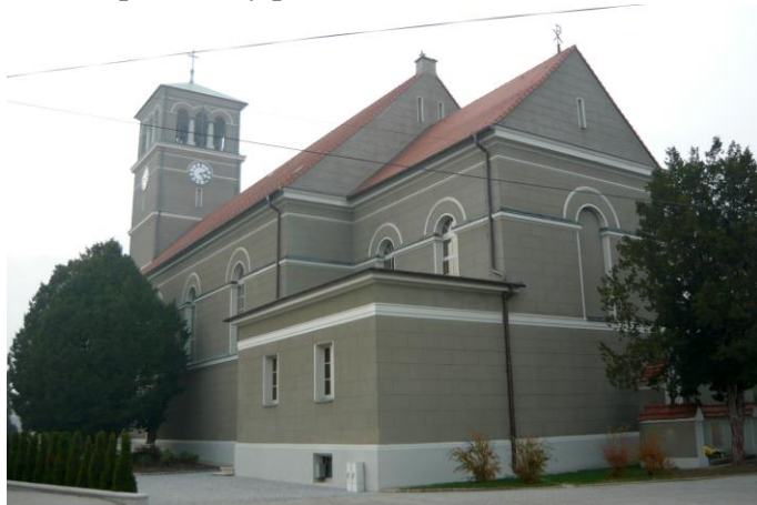
Zdjęcie nr 6. Kościół parafialny pw. św. Michała Archanioła, ul. Michała, Stare Siolkowice