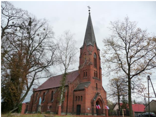
Zdjęcie nr 1. Kościół parafialny pw. św. Michała Archanioła w Karłowicach, ul. Kościelna

Wzmiankowany w 1500 r., od 1534 r. w posiadaniu ewangelików. Obecny zbudowany jako ewangelicki u schyłku XIX w. w stylu neogotyckim, w miejscu kościoła poprzedniego. Po 1945 r. przejęty przez katolików. Usytuowany w centrum wsi, po pñ. stronie ul. Kościelnej. Wokół teren rozplantowany, obsiany trawą, na pñ. od kościoła pozostałości cmentarza ewangelickiego. Zbudowany z cegły prasowanej, z zewnątrz nietynkowany; wnętrza przykryte sklepieniami krzyżowo-żebrowymi; poszycie korpusu nawowego blachą falistą, prezbiterium i wieży blachą miedzianą.