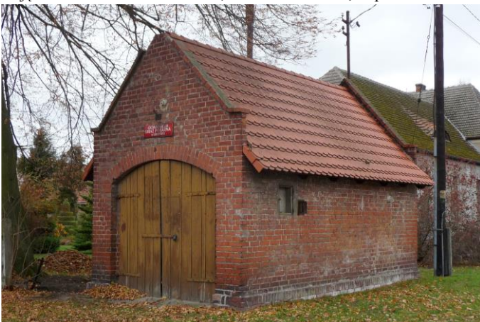
Zdjęcie nr 21. Remiza strażacka, ul. Wiejska, dz. nr 443, Lubienia

W każdej wsi na terenie gminy powstała kiedyś remiza strażacka - czyli budynek na pomieszczenie wozu strażackiego i innego sprzętu przeciwpożarowego. Największy zespół zabudowań tego rodzaju powstał w Starych Siołkowicach - zlokalizowany w centrum wsi, który utracił walory zabytkowe. Najefektowniej przedstawia się remiza w Popielowie. Usytuowana jest w centrum wsi, w pobliżu kościoła. Jest ona większa od innych, posiada drewnianą, kwadratową wieżę. W pozostałych wsiach są to jednoprzestrzenne budyneczki przykryte dachem dwuspadowym, z wrotami w ścianie szczytowej. Taką formę mają remizy w Stobrawie, Lubieni i Popielowskiej Kolonii. Remiza w Lubieni znajduje się w złym stanie technicznym.