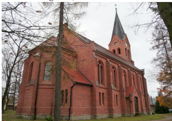
Zdjęcie nr 3. Kościół ewangelicki, Lubienia