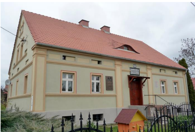
Zdjęcie nr 17. Dom Jana Dzierżona, ul. Kościelna 7, Karłowice

Zgodnie z inskrypcją umieszczoną w elewacji frontowej budynek zbudowany w 1864 r. Przez wiele lat zamieszkiwany przez ks. Jana Dzierżona, o czym informują tablice - niemiecka z 1925, a także późniejsze z 1956 r. i 2011 r. w języku polskim. Budynek usytuowany w centrum wsi,