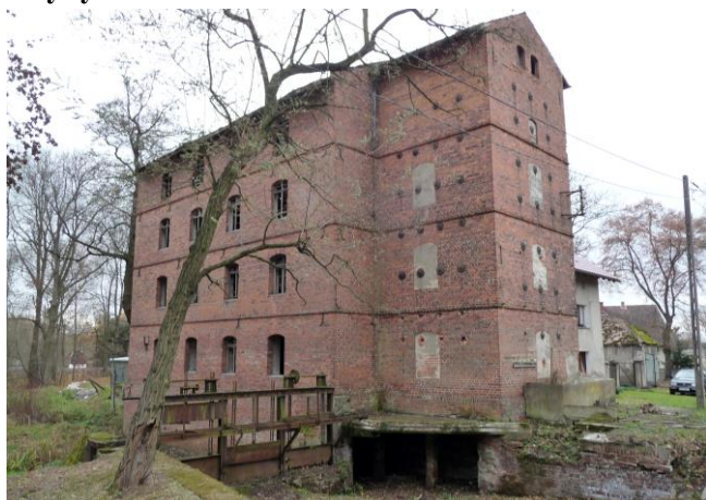
Zdjęcia nr 25. Dawny młyn, ul. Młyńska 9, Karłowice