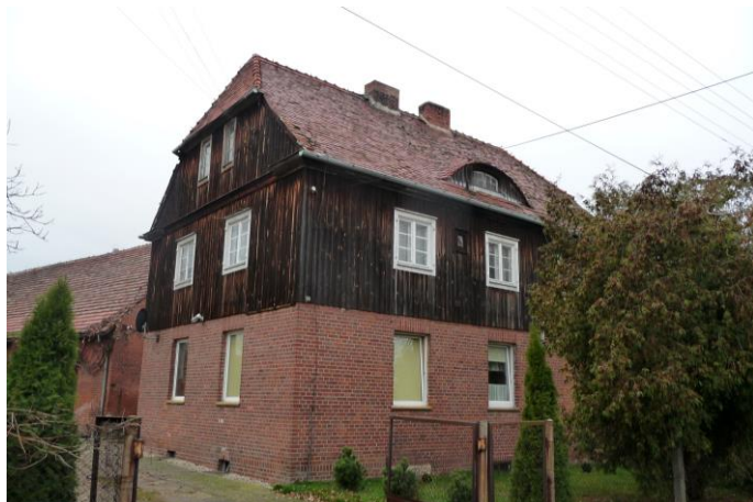
Zdjęcie nr 22. Dawna leśniczówka, ul. Kani 17, Stobrawa