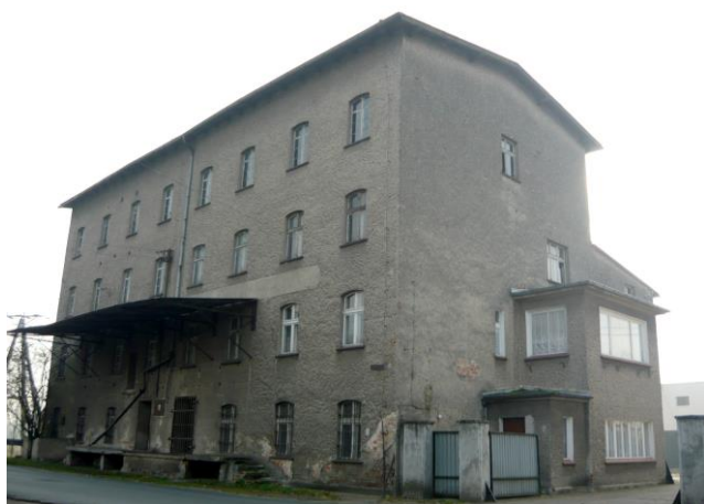
Zdjęcie nr 26. Dawny młyn, ul. Opolska 36, Popielów

Młynarstwo było jedną z najbardziej intratnych profesji. Dawniej młyny wodne funkcjonowały w Popielowie, Starych Siołkowicach, Karłowicach (przy zamku i na Olszaku), w Kuźnicy Katowskiej, w Starych Kolniach i Stobrawie. O istnieniu młynów w Popielowie, Siołkowicach wspominają dokumenty z XIV w. Do napędu młynów wykorzystywano nurty lokalnych rzek Brynicy i Stobrawy. Obiekty te funkcjonowały nieprzerwanie od średniowiecza, aż po czasy nam najbliższe. Były wielokrotnie przebudowywane, modernizowane, niszczone i budowane na nowo.