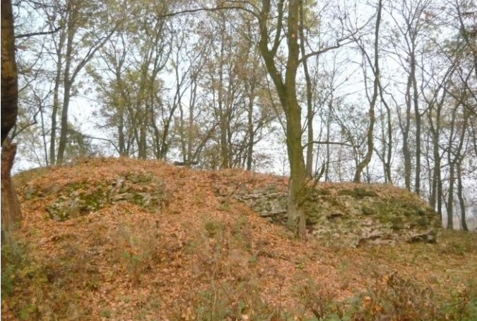
Zdjęcie nr 16. Relikty zamku Kolno, Stare Kolnie

Gotycki zamek Kolno wzniesiony prawdopodobnie u schyłku XIII w. jako strażnica - komora celna strzegąca wsch. granicy księstwa wrocławskiego, później brzeskiego. W 1317 r. książę brzeski Bolesław III przeniósł komorę do Brzegu, a sam zamek odsprzedał w ręce prywatne. W 1443 r. właścicielem została rycerska rodzina von Beess. Dwa tygodnie przed nabyciem zamku od księżnej brzesko - legnickiej zamek został zniszczony przez wojska koalicji ks. ziebicko - opawskiego Wilhelma i biskupstwa wrocławskiego.