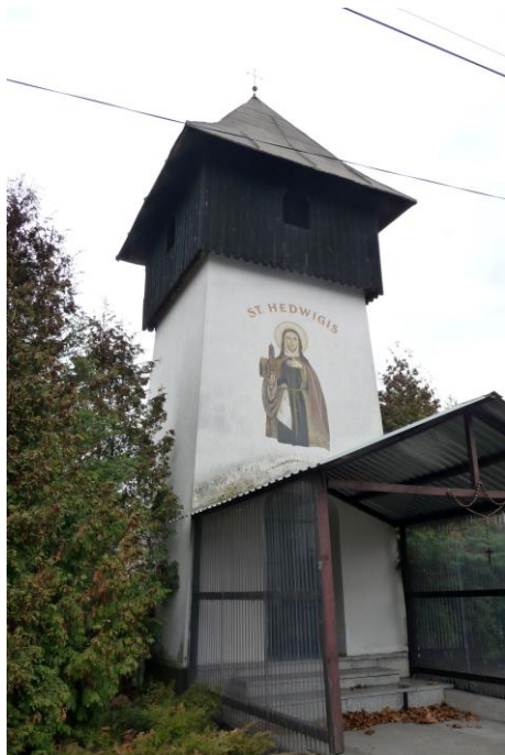
Zdjęcie nr 9. Kapliczka-dzwonnica, ul. Wiejska przy nr 36a, dz. nr 231/2, Nowe Siołkowice