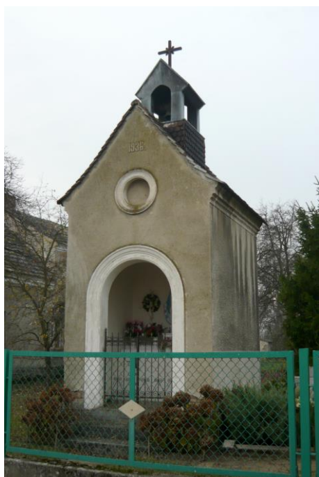
Zdjęcie nr 11. Kapliczka, ul. Powolnego 11, Popielów

Na terenie gminy znajduje się tylko jeden zabytek tego rodzaju. Jest to kapliczka wzniesiona w 1936 r. przy ul. Powolnego 11, na terenie Popielowie. Przez lata służyła jako miejsce odprawiania nabożeństw dla mieszkańców tego przysiółka. Wyposażona w sygnaturkę na kalenicy dachu. Wnętrze budowli otwarte, we wnętrzu figurka Matki Boskiej. Nie posiada wyraźnych cech stylowych; w ogólnej formie nawiązuje do tego rodzaju kapliczek wznoszonych na terenie Śląska w XVIII i XIX w.