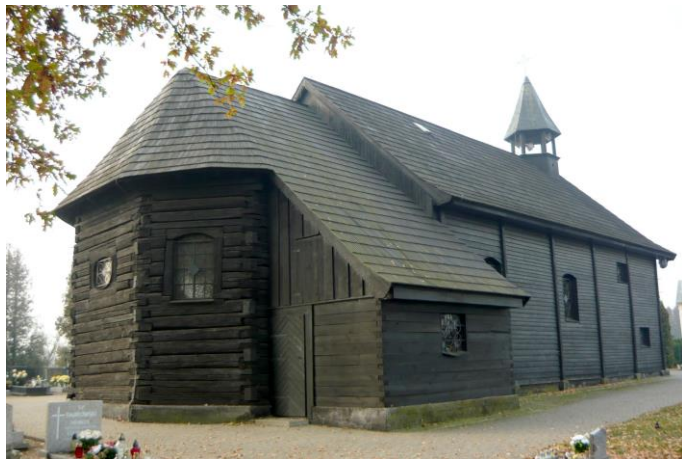
Zdjęcie nr 4. Kościół, obecnie cmentarny, pw. Matki Boskiej i św. Andrzeja w Popielowie, ul. Dworcowa