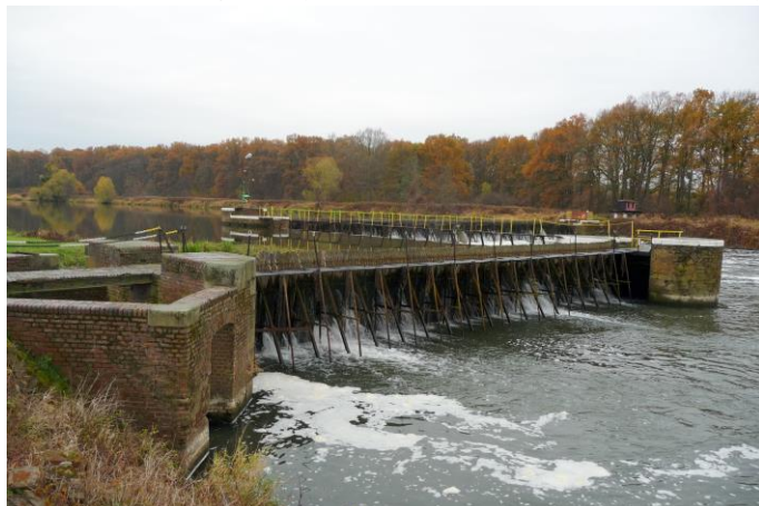
Zdjęcie nr 18. Jaz kozłowo - iglicowy, ul. Odrzańska, dz. nr 510/6, Rybna

Stopień wody Ujście Nysy do Odry w Rybnej, został zbudowany w latach 1892 - 1896, w ramach realizowanego programu modernizacji Odry. Był jednym z trzynastu tego typu obiektów na Odrze. Obejmuje on między innymi jaz kozłowo - iglicowy systemu Poirée, początkowo z małą służą komorą, uzupełnioną w pocz. XX w. o służę pociągową długości ok. 180 m, która umożliwiała przepływ barek. Obsługiwany jest ręcznie. Obiekt bardzo dobrze zachowany.