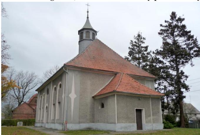
Zdjęcie nr 2. Kościół ewangelicki, ob. katolicki filialny pw. św. Judy Tadeusza w Kurzniach, ul. Mickiewicza