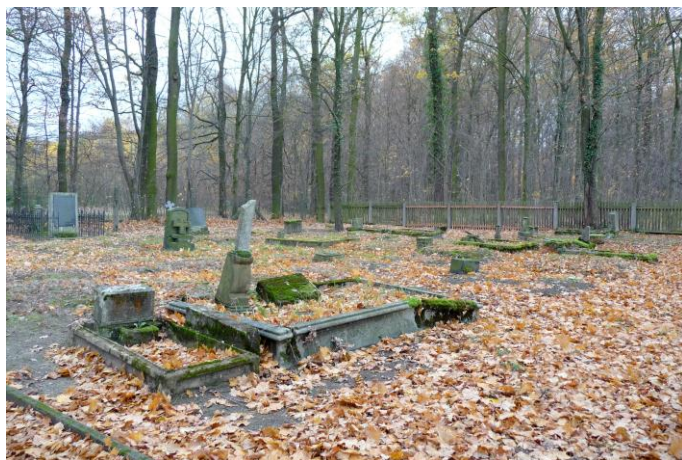
Zdjęcie nr 12. Cmentarz ewangelicki, ul. Odrzańska, Popielowska Kolonia