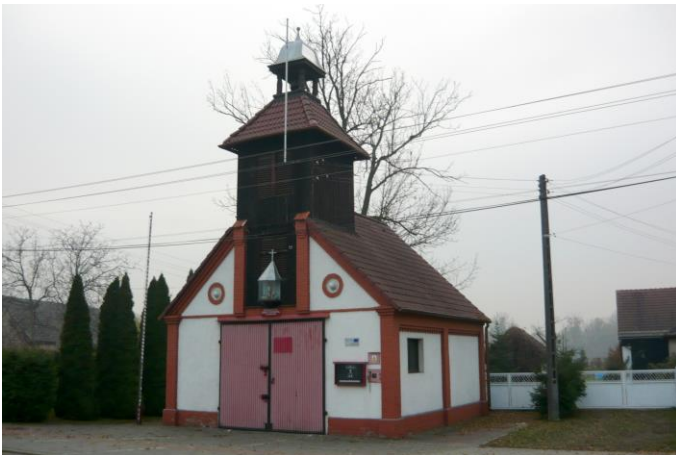
Zdjęcie nr 20. Remiza strażacka, ul. Kościuszki 17, Popielów