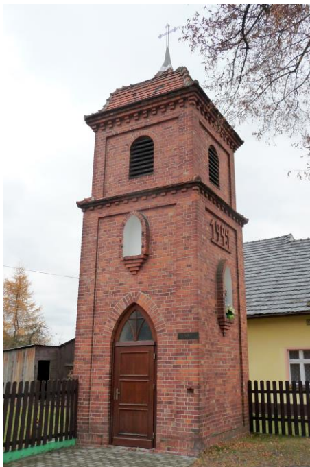
Zdjęcie nr 10. Kapliczka-dzwonnica, skrzyżowanie ul. Witosza/Szkolna, dz. nr 240, Kaniów

Kapliczki wieżowe łączyły funkcję miejsca kultu oraz wiejskiej dzwonnicy. Na terenie gminy spotykamy tylko dwa tego typu obiekty: kapliczka - dzwonnica św. Jadwigi Śląskiej z 1935 r. w Nowych Siołkowicach przy ul. Wiejskiej 36a. Zbudowana z cegły, otynkowana, o ścianach zwężających się ku górze, z ostatnią kondygnacją w postaci drewnianej izbicy, z wizerunkiem patronki namalowanym na frontowej elewacji. Wewnątrz znajduje się tablica z nazwiskami mieszkańców poległych w I i II wojnie światowej. Druga kapliczka - dzwonnica znajduje się w Kaniowie - stoi na skrzyżowaniu ulic Wiejskiej i Szkolnej. Zbudowana w 1924 r. z cegły, nieotynkowana, w formie trzykondygnacyjnej wieży, przykryta dachem w kształcie hełmu, z metalowym krzyżem. Od wsch. otwór drzwiowy, od płd. nisza z figurką Matki Boskiej z Dzieciątkiem, nad nią data 1924, ukształtowana z cegieł, ma cechy eklektyczne, łączące elementy neogotyckie i neobarokowe.