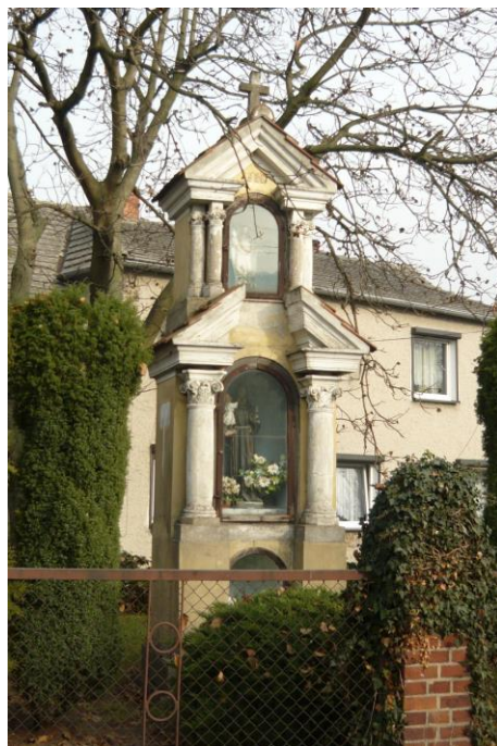
Zdjęcie nr 7. Kapliczka, ul. Wiejska 35, Nowe Siołkowice Zdjęcie nr 8. Kapliczka, ul. Opolska 7, Popielów

Najstarszą kapliczką słupową jest kapliczka usytuowana w Nowych Siołkowicach przy ul. Wiejskiej 35 pochodząca z 1 ćw. XIX w. - dwukondygnacyjna, o bryle prostopadłościennego słupa krytego dwuspadowym daszkiem, we wnętrzu figura św. Jana Nepomucena. Pod koniec XIX w. w Starych Siołkowicach upowszechnił się specyficzny typ kapliczki słupowej, której formę można uznać za rodzaj regionalizmu. Cechą tych kapliczek jest ekspozycja ceglano-budulca, styl neogotycki, układ dwukondygnacyjny oraz charakterystyczne symetryczne wcięcie (przewężenie) między kondygnacjami. Za najstarszy przykład tej formy można chyba uznać kapliczkę w Starych Siołkowicach przy rondzie, datowaną na 1890 r. We wnętrzu znajduje się drewniana figura św. Jana Nepomucena, o cechach późnobarokowych pierwowzorów. Najbardziej charakterystyczne kapliczki noszące wyżej opisane cechy powstawały około 1900 r. i na pocz. XX w., aż po około 1920 r.