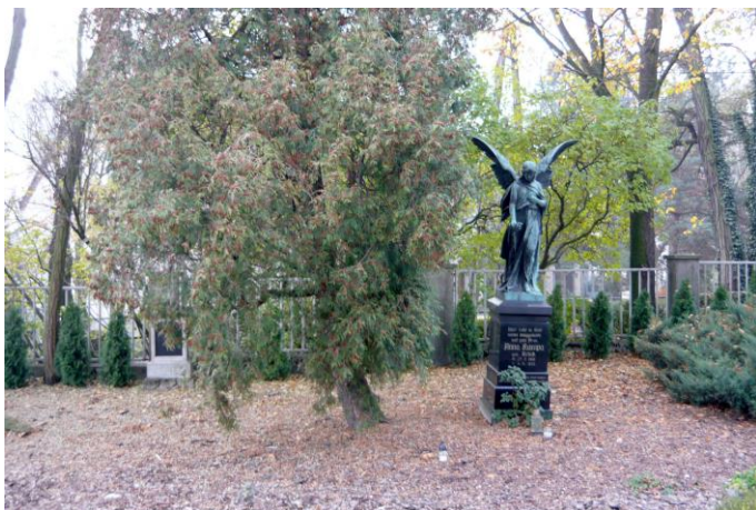
Zdjęcie nr 13. Cmentarz przykościelny, ul. Michała, Stare Siołkowice

Na terenie gminy Popielów odnaleźć można kilka typów cmentarzy. Znajduje się 7 zabytkowych cmentarzy, z czego 1 to cmentarz przykościelny w Starych Siołkowicach, 1 cmentarz parafialny w Popielowie, 2 cmentarze ewangelickie w Lubieni i Kolonii Popielowskiej, 2 cmentarze rzymskokatolickie w Karłowicach, jeden przy kościele (dawny protestancki), drugi nieopodal plebanii, 1 miejsce pocmentarne (dawny cmentarz staroluterański) w Karłowicach, przy ul. Karłowiczki.