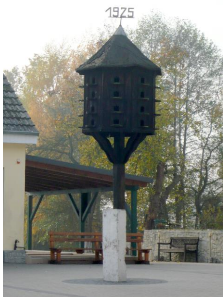
Zdjęcie nr 24. Gołębnik, ul. Opolska 3, Popielów

Te niewielkie obiekty gospodarcze dawniej znajdowały się niemal w każdej zagrodzie. Budowano je z drewna w formie niewielkiego „budyneczku” umieszczonego na wysokim słupie. Do dnia dzisiejszego zachowały się jedynie dwa gołębniki tego rodzaju, oba znajdują się w Popielowie: przy ul. Opolskiej 30 i Opolskiej 2, powstałe w 1925 r.