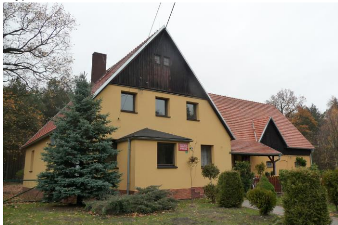
Zdjęcie nr 23. Leśniczówka, ul. Leśna 2, Stobrawa

Na terenie gminy znajdują się trzy zabytkowe leśniczówki. Dwie z nich powstały w Stobrawie. Jest to zespół zabudowań leśnictwa zlokalizowany po obu stronach ul. Kani 17, który składa się z budynku głównego, o ceglano - drewnianej architekturze, obok stoi stodoła o konstrukcji ryglowej z ceglanym wypełnieniem. Po drugiej stronie drogi znajduje się niewielki budynek gospodarczy i stodoła w konstrukcji ryglowej. Wszystkie budynki powstały około 1925 r. Obecnie nie pełnią pierwotnej funkcji - zabudowania gospodarcze zostały opuszczone, budynek główny pełni rolę budynku mieszkalnego. Druga leśniczówka w Stobrawie, powstała około 1925 r. i do dzisiaj użytkowana jest zgodnie z pierwotnym przeznaczeniem. Ma formę rozległego domostwa na planie litery „T” łączącego funkcję administracyjną, mieszkalną i gospodarczą. Wzniesiono ją z cegły, z użyciem drewnianych szalunków w szczytach. Trzecia leśniczówka znajduje się w Lubieni. Wzniesiona w około 1900 r. Usytuowana w centrum wsi, naprzeciwko kościoła. To niewielka budowla o ceglanym licu, wzniesiona na podmurówce z kamienia wapiennego. Obok niewielka stodoła o ryglowej konstrukcji.