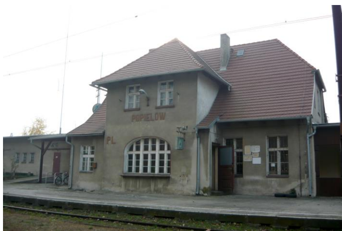
Zdjęcie nr 19. Budynek stacji PKP, ul. Dworcowa 69, Popielów

Na początku XX w. poprowadzono prawobrzeżną nitkę kolejową łączącą Wrocław z Opolem. Linia przebiega przez cztery wsie na terenie Gminy - Stare i Nowe Siołkowice, Popielów i Karłowice. Stacje powstały w Popielowie i Karłowicach. Towarzyszą im zabudowania związane z infrastrukturą kolejową oraz budynki mieszkalne dla osób zajmujących się jej obsługą - w większości wzniesiono je w 1 ćw. XX w. Stacja w Popielowie w formie nawiązuje do typowego budynku stacyjnego. Stacji towarzyszy szalec wzniesiony w konstrukcji szkieletowej oraz dwa domy kolejarzy. Do jej zespołu