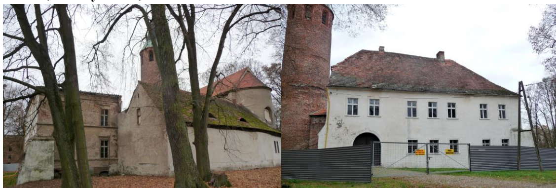
Zdjęcia nr 14, 15. Zamek, ul. Młyńska 7, Karłowice

Najcenniejszym zabytkiem na terenie gminy jest gotycki zamek, zbudowany na planie trapezu, powstał około w 1350 r. Wzniósł go rycerski ród von Tschammer, który posiadał Karłowice w latach 1329 – 1411.. Od 1440 r. zamek należy do rodu von Beess. Z tego okresu zachowane znaczne partie murów obwodowych, fragmenty bramy oraz cylindryczna wieża. Od 1493 r. karłowickie dobra należały do Adama Beessa, marszałka, później namiestnika księstwa brzeskiego. Karłowickie dobra kupił w 1565 r. książę brzeski Jerzy II od Beessów. Od tego czasu jest to zamek myśliwski brzeskich Piastów, aż do 1675 r., w którym zmarł ostatni przedstawiciel Piastów ks. Jerzy Wilhelm. W 1715 r. dobudowano barokową kaplicę. W XIX w. zamek powiększono o budynek mieszkalny od wsch. Zamek odnawiany w 1930 r.