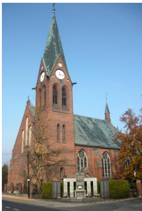
Zdjęcie nr 5. Kościół parafialny pw. Najświętszej Marii Panny Królowej Aniołów, ul. Kościuszki, Popielów

Kościół usytuowany jest w centrum wsi, po wsch. stronie ul. Kościuszki, na prostokątnej parceli, ograniczonej od frontu, który pochodzi z czasu budowy kościoła, ażurowym ogrodzeniem rozpiętym między murowanymi z cegły słupkami.