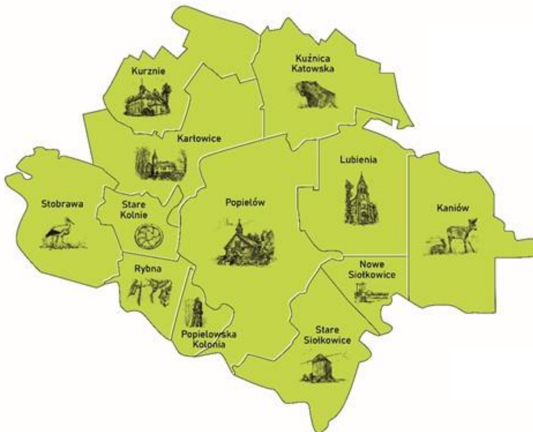
Rysunek 3. Mapa Gminy Popielów