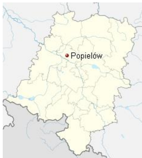
Rysunek 1. Położenie Gminy Popielów w województwie opolskim.