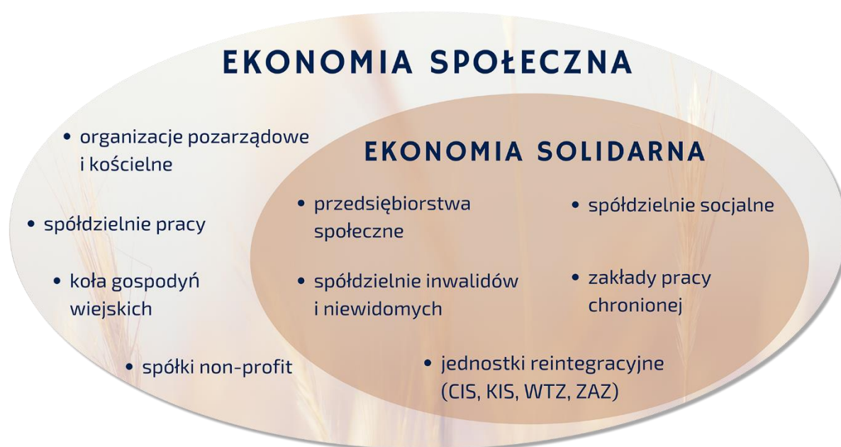
Rysunek 2. Podmioty ekonomii społecznej.